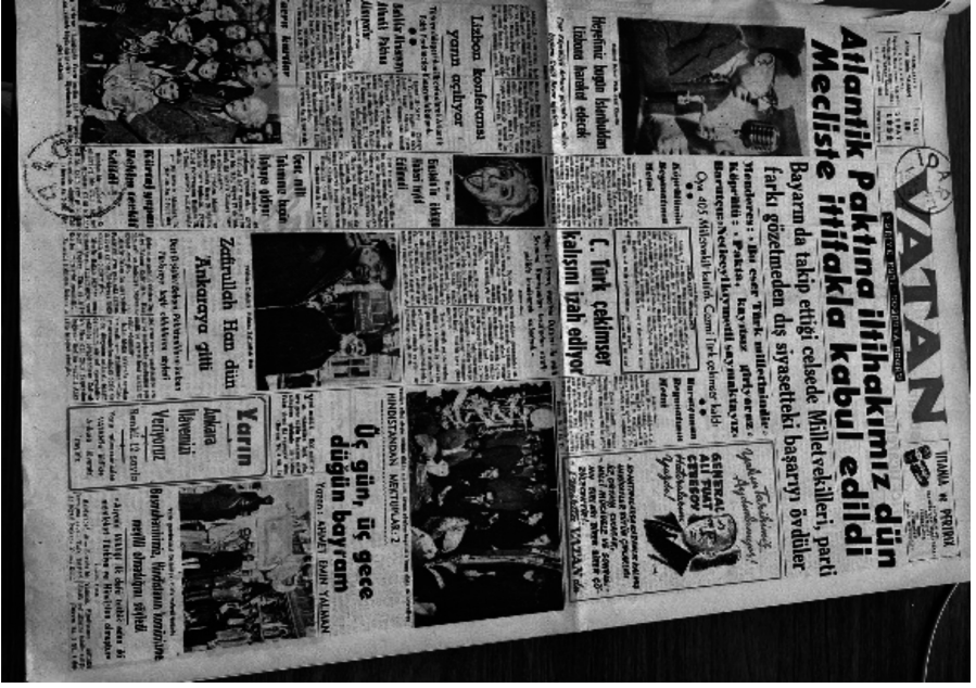
Ek 4. Vatan Gazetesi, 19 Şubat 1952