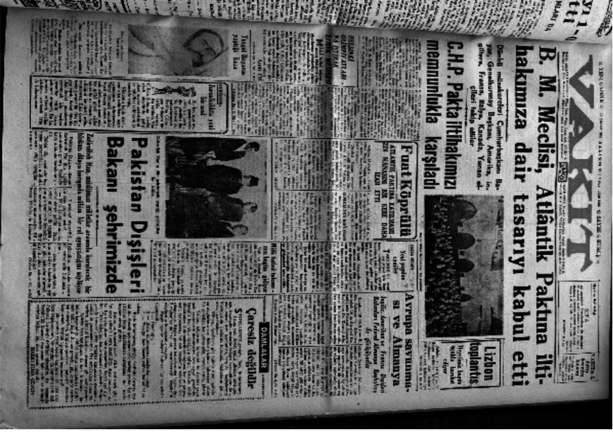
Ek 6. Vakit Gazetesi, 19 Şubat 1952