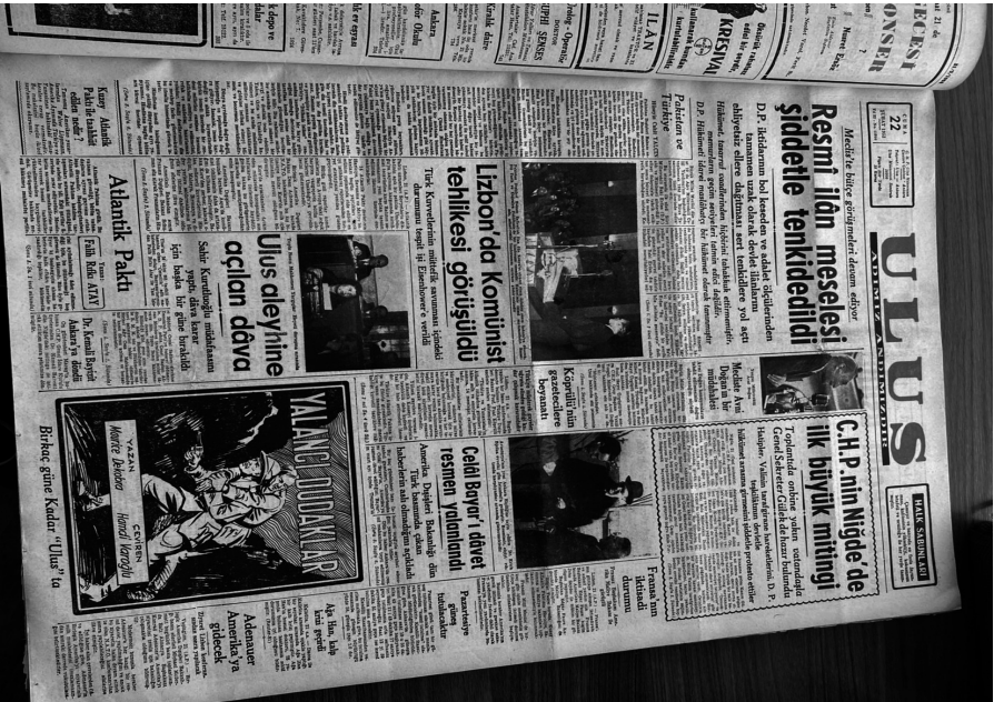
Ek 3. Uluş Gazetesi, 22 Şubat 1952