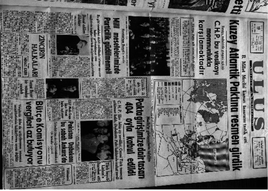
Ek 2. Uluş Gazetesi, 19 Şubat 1952