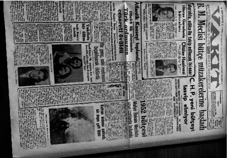
Ek 7. Vakit Gazetesi, 21 Şubat 1952