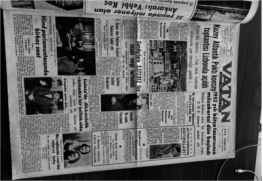
Ek 5. Vatan Gazetesi, 21 Şubat 1952